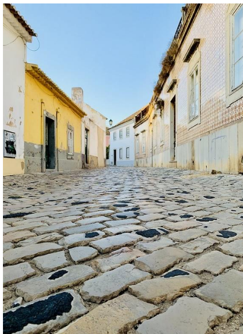
Denise Miltenburg - Follow my footprints